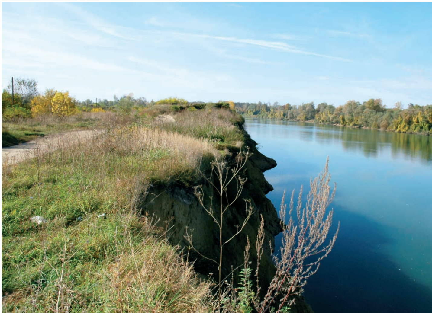
Arheološko nalazište „Gomolava“ u Hrtkovcima

At “Gomolava” a residential horizon from the 1 st century was recorded, with houses built from mud and straw, ceramic kilns and pits containing rich native finds and Italic import. Pottery production is characterized by Roman provincial forms from the 1 st –2 nd centuries. The Late La Tène occupation yielded a cache of republic coins dating from about the year 10 BC. From the 1 st century local population under the Roman influence extends the