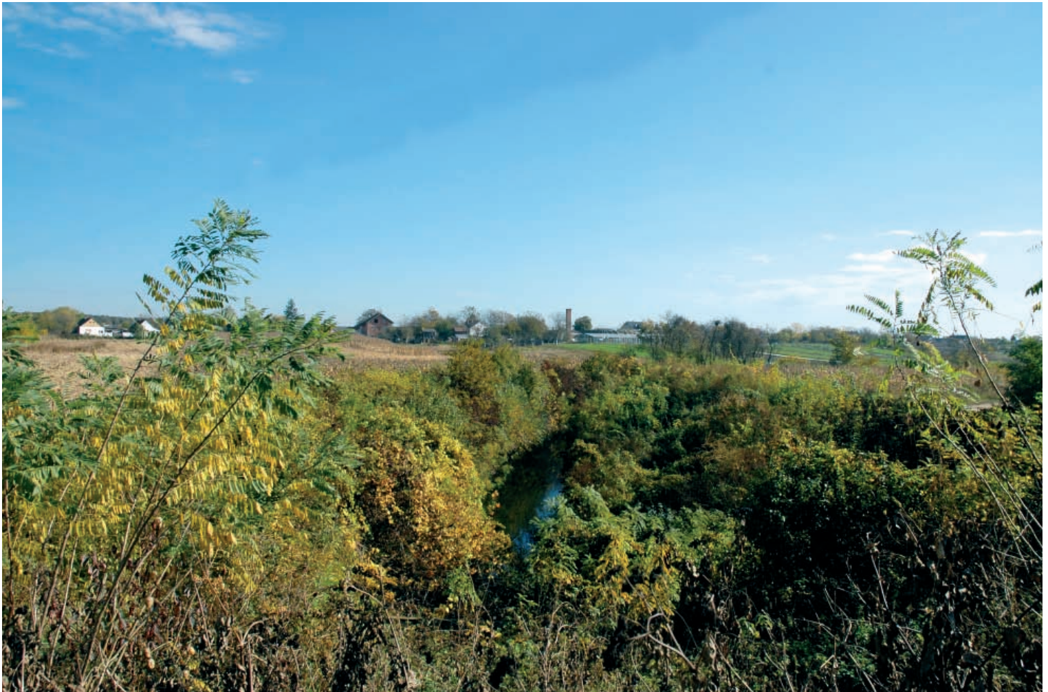
Potok Vranj i potes sa kompleksom vile rustike u Hrtkovcima / The stream of Vranj and the site with the villa rustica complex in Hrtkovci

naselje istočno i južno od prvobitno tradicionalnog staništa na „Gomolavi“, zapravo koristi široku ravnicu u zaleđu Save presečenu manjim potokom Vranj, na potesima koji su danas poznati kao „Vranj“ i „Krčevine“. U I i II veku naselje ima privredni karakter. O tome svedoče brojne peći za izradu keramičkih proizvoda, amfora, cediljki, pitosa i vodovodnih cevi, i jame koje su bile u funkciji ove proizvodnje. U III i IV veku već potpuno romanizovano stanovništvo živi i privređuje u objektima zidanim od opeke i kamena vezivanih krečnim malterom (villa rustica). Osnovna privredna delatnost, izrada keramičkih proizvoda, omogućena kvalitetnim prirodnim sirovinama i blizinom vode, ostaje ista, a zabeleženi su brojni tragovi metalurške obrade i zanatske izrade metalnih predmeta.